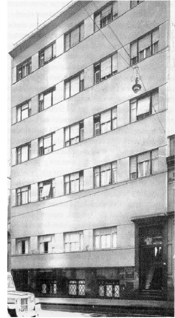
Fig. 4. Clínica Albanese (en la calle Bartolomé Mitre)

Entre sus libros mencionamos: el de “Pancreatitis aguda”, de 1942. Luego, el “Manual de bloqueos anestésicos del sistema neurovegetativo: Anestésias del Simpático”, de 1947, prologado por Ricardo Finochietto y que en los años 50 se constituyó en lectura de cabecera en los países de habla hispana. También en 1947 el libro “Cirugía de la hipertensión arterial”, editado con aval de Ricardo Finochietto. Estos tres primeros libros, tratan sobre la anatomía quirúrgica del simpático y su aplicación terapéutica. Fue un pionero en cirugía del sistema simpático. Algunos años más tarde, en 1977, “El apéndice, la apendicitis y la apendicectomía”, libro extraordinario que aún acompaña a muchos profesionales jóvenes. Una mención espe-