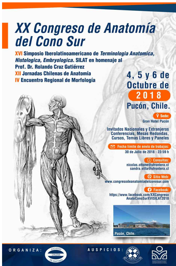
Fig. 12. Poster del XX Congreso de Anatomía del Cono Sur realizado el 2018 en Pucón, Chile.

recién radicado en Chile, que había ingresado a la Sociedad Chilena de Anatomía, siendo actualmente uno de sus directores; y además Profesor Asociado de la Facultad de Odontología de la Universidad de La Frontera, Chile. Este es uno de los ejemplos de esta unión científica trasandina. (Fig. 13).