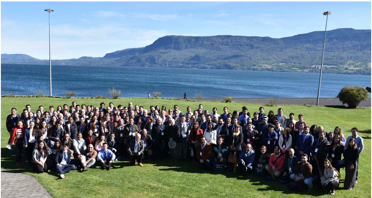
Fig. 20. Foto grupal de algunos de los asistentes al XX Congreso de Anatomía del Cono Sur realizado en octubre de 2018 en Pucón, Chile. Fotografía tomada en los jardines del Hotel, frente al lago Villarrica. Se observan profesores y estudiantes de postgrado de Argentina, Bolivia, Brasil, Chile, Colombia, Ecuador, Estados Unidos, Rusia y Uruguay.