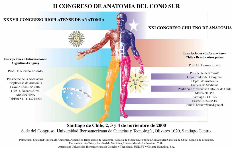
Fig. 2. Poster del II Congreso de Anatomía del Cono Sur, realizado en la ciudad de Santiago de Chile.