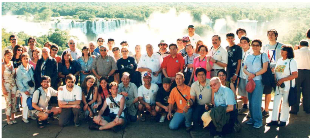
Fig. 3. Delegación chilena participante del VI Congreso de Anatomía del Cono Sur realizado en Foz de Iguazú en Foz de Iguazú, Brasil y Puerto Iguazú, Argentina, durante los días 24, 25, 26, 27 y 28 de octubre de 2004.