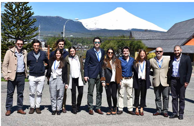
Fig. 18. Participantes de la delegación uruguaya en el XX Congreso de Anatomía del Cono Sur realizado en octubre de 2018 en Pucón, Chile.