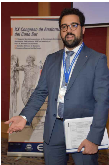
Fig. 13. Prof. Dr. Nicolás E. Ottone, Presidente del XX Congreso de Anatomía del Cono Sur, Pucón 2018.

El congreso terminó con un paseo turístico-cultural, visitando el lago Caburgua y con un almuerzo de confraternidad en una de las típicas termas-balneario del sector montañoso de la región. Las Figuras 16-20 muestran la participación de los congresistas.