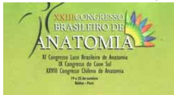
Fig. 9. Certificado del X Congreso de Anatomía del Cono Sur realizado en Belém, Brasil.

Terminado el Congreso, algunos profesores extranjeros, previamente vacunados contra la fiebre amarilla, comenzaron su “turismo académico” navegando