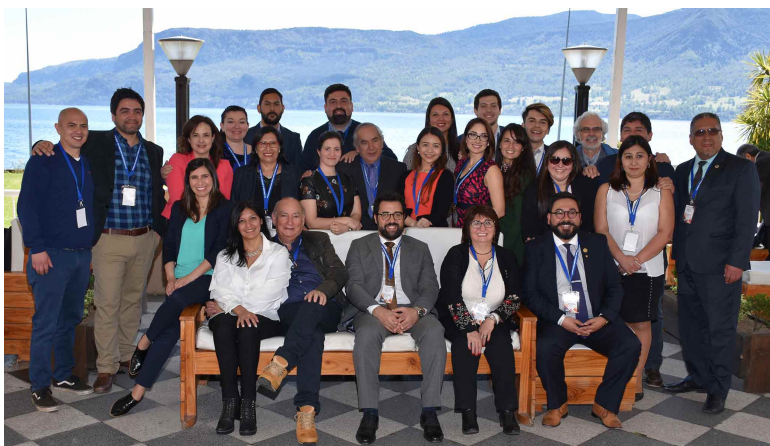
Fig. 17. Foto grupal de estudiantes y profesores del Programa de Doctorado en Ciencias Morfológicas de la Universidad de La Frontera asistentes al XX Congreso de Anatomía del Cono Sur realizado en octubre de 2018 en Pucón, Chile.

Como fue mencionado anteriormente, solamente el año 2018 el XXXIX Congreso Chileno de Anatomía no se realizó junto al Congreso de Anatomía del Cono Sur, ya que en julio de ese año, se unió al XXVIII Congresso Brasileiro de Anatomia evento realizado en la ciudad de João Pessoa, Brasil.