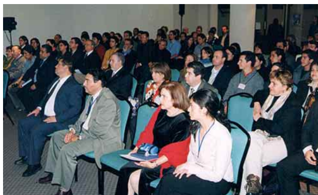
Fig. 7. Asistentes en uno de los salones del V Congreso de Anatomía del Cono Sur, 2004.

El Congreso se realizó en el Hotel Terraverde, situado en las faldas del Monumento Natural el Cerro Ñielol de Temuco: un parque y reserva ecológica de la ciudad de Temuco. El hotel de 5 estrellas a pesar de su gran capacidad, fue colmado por la masiva asistencia y muchos congresistas tuvieron que alojarse en otros nueve hoteles y en un apartamento de la ciudad. Un elegante hotel, que poco tiempo después fue vendido y destinado al Centro de Justicia de Temuco. Fotografías en el día de la inauguración (Fig. 5) y durante el congreso (Figs. 6 y 7).