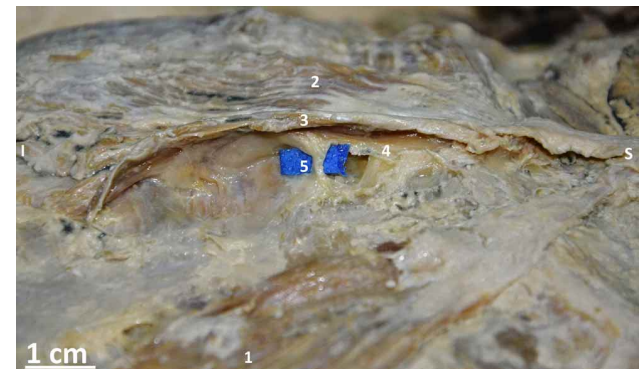
Fig. 4. Diseción de la pared anterior de tórax, se expone vascularización e inervación de los músculos esternales. 1. M. Esternal izquierdo; 2. M. Esternal derecho; 3. Lámina superficial del M. Esternal derecho; 4. Lámina profunda del M. Esternal derecho; 5. Nervio cutáneo anterior y vasos perforantes.