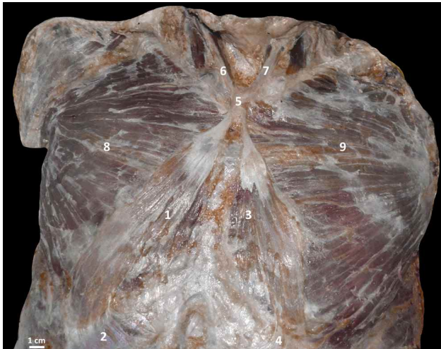
Fig. 1. Diseción de la pared anterior de tórax. 1. M. Esternal derecho; 2. Tendón inferior; 3. M. Esternal izquierdo; 4. Tendón inferior; 5. Tendón común; 6. Cabeza esternal del ECMD; 7. Cabeza esternal del ECMI; 8. M. Pectoral mayor derecho; 9. M. Pectoral mayor izquierdo.